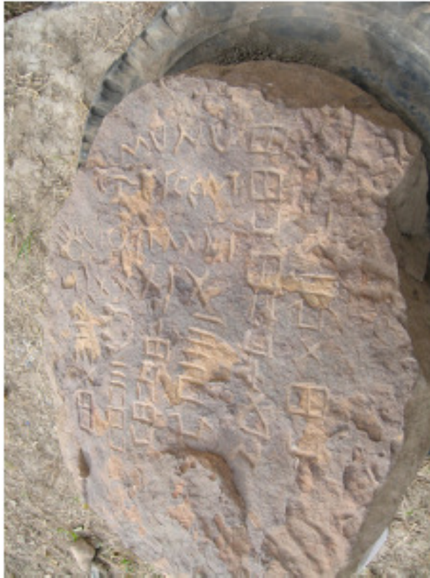
Texte latin (AE, 2007, 1754) : munu(mentum) / Crescenti / uicxit anni(s) / LXXXXIX.