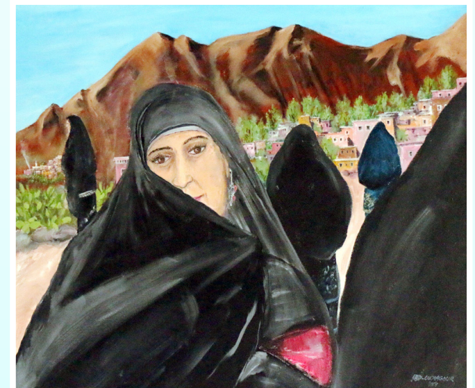
Istwameln, Beautés de la vallée des Ameln.