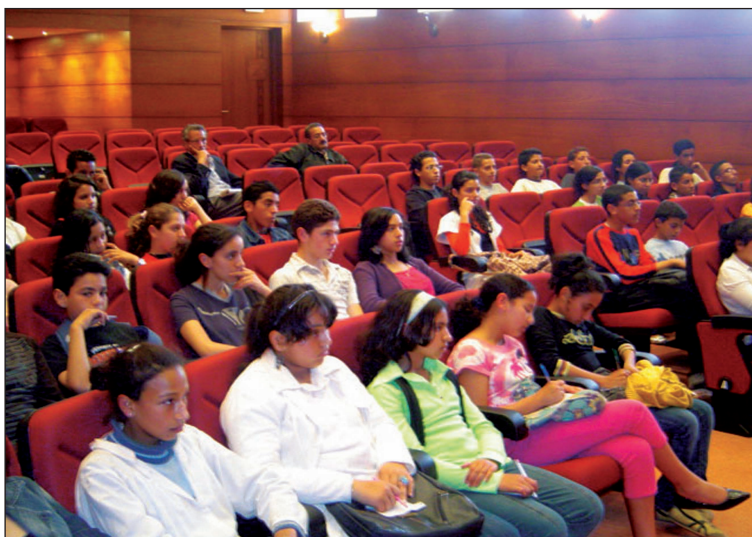
Elèves de l'établissement Al Irfane

Les élèves ont visité les locaux de l'Institut, notamment la bibliothèque. Des exemplaires des publications de l'IRCAM (CD, Bandes Dessinées...) ont été offerts aux visiteurs.