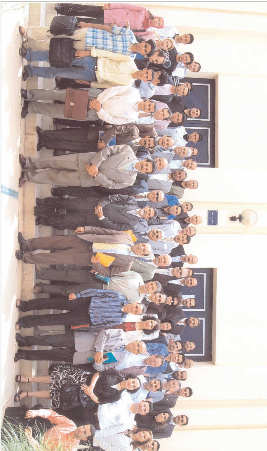
Participants au colloque