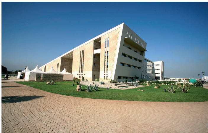
Siège de l'IRCAM

- Cette commission a tenu plusieurs réunions (18/01/08 - 22/02/08 - 06/03/08 - 28/03/08 - 10/04/08) pour mettre au point un plan d'action et un programme de travail de la commission dans le domaine du droit.