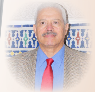
ⴰⵎⴻⵣⴰⵏⵜ : ⴰⵎⴻⵣⴰⵏⵜ ⴰⵎⴻⵣⴰⵏⵜ Auteur : Pr. Moha Ennaji