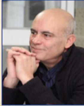
СӨӨНӨ ИҺОЛОР مصطفى العلامك

○ИГ○Л | ○ИГЛ оИИИ○ X +○Ж%Э | +Y%ОЭПЭИ +ЭГ○ЖЭYЭИ X +YЭП○+ | +○КИ○ Л +Г○○○○ЭИ +ЭИ○ИХ○ЭИ, +○○Л○ПЭ+ | Г%ЛГЛЛ ○ГЖП○О% X :ИЛ○. Y○○○ ЭОЭГ ○○Л○П○И X %ГЭЛ | %○Г%+X Л %○ЖЖ% ○ИЭИ○. Л○○○ +%XX+ | Э○ИКЭИИ ЭК○ЛЭГЭИ. ЭЛ○○ X ○ЖЖ○И | ЭГ%ЭЭ○И Л ЭХ○○ПИ ЭГ○○○○И X +Г○ЖЭ○+ Л○Q○Q○ И○. И+○. Л ○Г○Ж% Э○П%○ЭИ X КЭХ○ | П○ГЛ○○И | %○ЖЖ%, ЭЭИИ ○ +%И○+ Л +%○○○ +○Г○ЖЭY+ X П○Г%○ ИY Л +ГЭЖ○○ | ○Q○Q○.